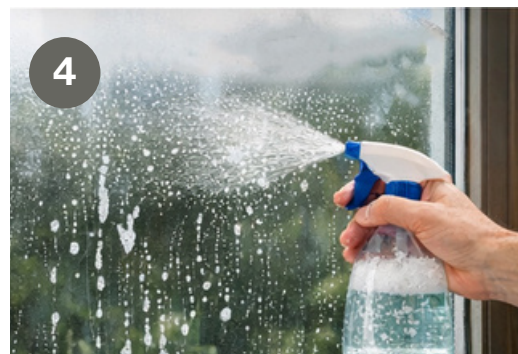
Schritt 4: Auftragen der Reinigungsflüssigkeit: entsprechende Menge eines neutralen Reinigungsmittels (Duschgel ist besser geeignet) in die Sprühflasche geben und gleichmäßig auf die Oberfläche des Glases sprühen Step 4: Deployment of installation liquid: add the appropriate amount of neutral detergent in the water (shower gel is better), into the spray bottle, and evenly spray on the surface of the glass