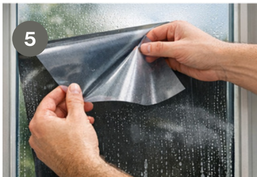
Schritt 5: Schutzfolie abziehen und die Folie auf die nasse Glasoberfläche legen Step 5: Tear off the release film, and place the film on the wet glass surface