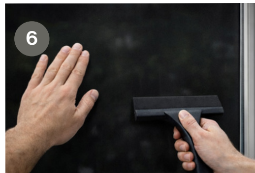
Schritt 6: Die Schutzfolie, die die Oberfläche der Fensterfolie bedeckt, mit einem Schaber entfernen, um Wasser und Blasen herauszudrücken Step 6: Release film as a protective film covering the surface of the window film, with a scraper to squeeze out the water and bubbles