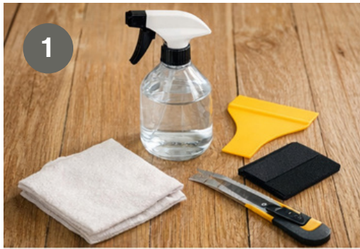
Schritt 1: Wasserflasche, Vliesstoff, einen Kunststoffschaber, einen Gummischaber und einen Cutter vorbereiten Step 1: Prepare water bottle, non-woven fabric, plastic scraper, rubber scraper, and cutter