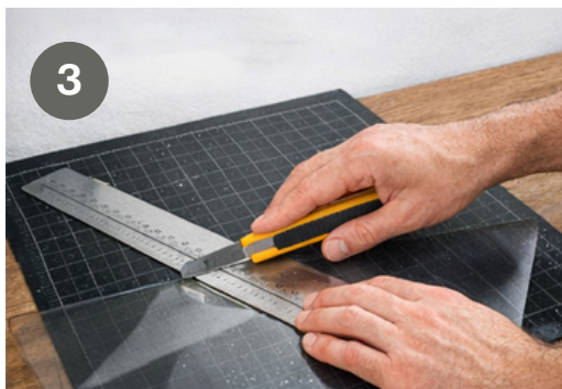
Schritt 3: Entsprechend der Fenstergröße die entsprechende Größe der Fensterfolie ausschneiden Step 3: According to the window size, cut out the corresponding size of the window film