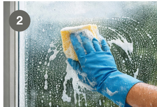
Schritt 2: Fensterglas mit Reinigungsmittel putzen Step 2: Wash the window glass with detergent